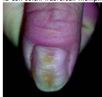
Figura 10. L'onicotillomania (tic nevrotico caratterizzato da traumatismo reiterato della plica prossimale) determina una depressione longitudinale combinata con solchi trasversali multipli.

Nel recente studio di confronto terbinafina vs itraconazolo, terbinafina si è dimostrata superiore alla dose di 250 mg/die per 3-4 mesi rispetto al trattamento con itraconazolo pulsato (400 mg/die x 7 gg all'inizio di ogni mese x 3-4 mesi). I migliori ri-