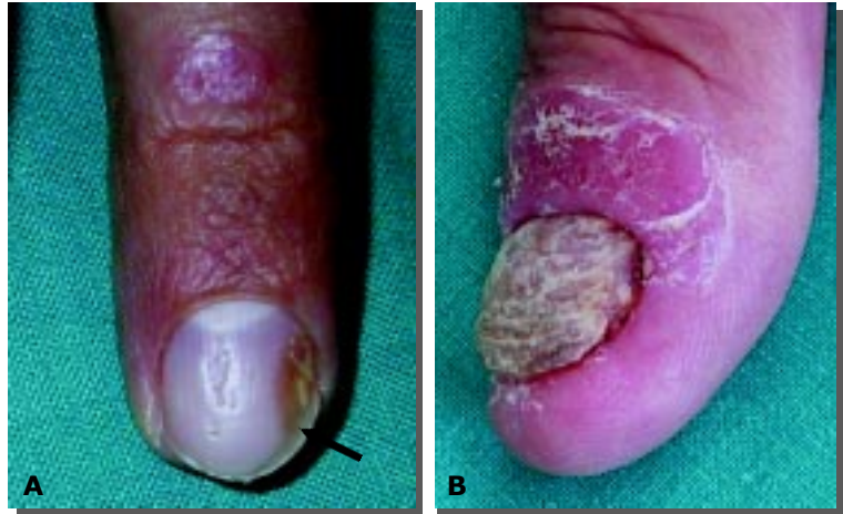
Figura 8. Onicopatia psoriasica. In A si possono notare un'area di onicolisi laterale a macchia d'olio (freccia) e, al centro della lamina, il tipico "pitting", con alcune depressioni puntiformi isolate ed altre confluenti a formare un'unica depressione a stria. In B è presente ipercheratosi a midollo di sambuco che coinvolge tutta la lamina. In entrambi i casi sono presenti chiazze psoriasiche sulla cute dello stesso dito.

non sospensibili, la tossicità potenziale e il costo del trattamento 22-24 . La gamma di soluzioni comprende: