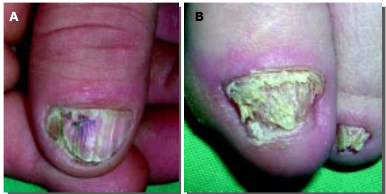
Figura 9. Onicopatia in corso di lichen planus . In A, la lamina è solcata longitudinalmente, frammentata al margine libero; è presente inoltre piccolo ematoma traumatico del letto ungueale. In B, la lamina ungueale dell'alluce è ispessita e ampiamente sgretolata; a livello del secondo dito, la lamina ipercheratosica mostra ancora la caratteristica striatura longitudinale.

topici tradizionali (creme, lozioni) hanno dimostrato efficacia limitata, con tassi di guarigione completa non superiori al 10% 25,26 . Tra i prodotti di più recente commercializzazione, appositamente formulati per il trattamento delle unghie, la ciclopiroxolamina (smalto all'8%) e l'amorolfina (smalto al 5%) danno risultati migliori, soprattutto in presenza di infezioni limitate per estensione e numero