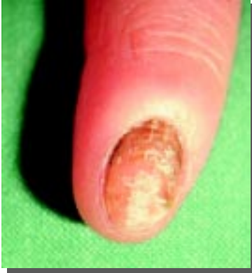
Figura 5. Onicomicosi laterale con perionissi da C. albicans .

fezioni candidiasiche multiple, cronico-recidivanti.