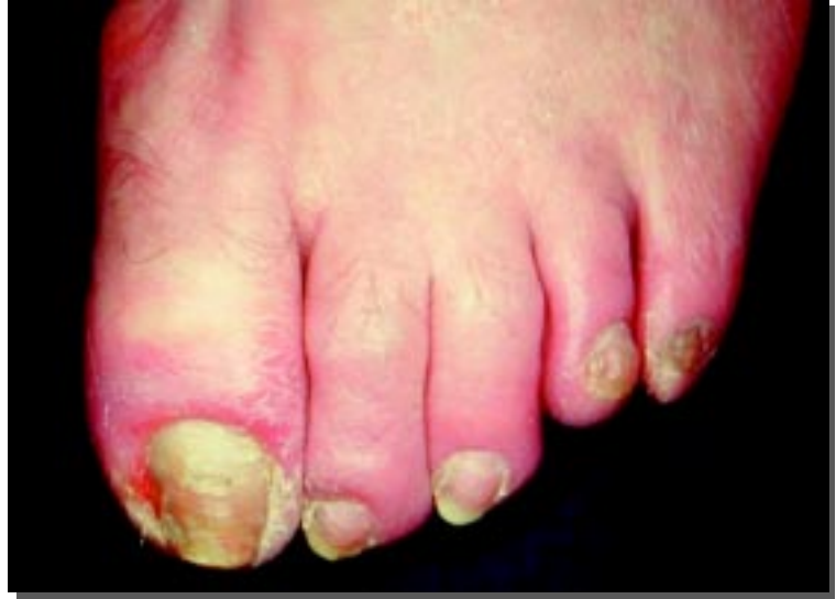
Figura 6. Onicomicosi laterale con perionissi da Fusarium oxysporum in soggetto con piede diabetico.

E' noto che l'età costituisce un fattore di rischio per il contagio; inoltre, lo sviluppo di micosi dell'unghia negli anziani è favorito dal ridotto trofismo locale e dalla frequente presenza di molteplici patologie. Gli studi di prevalenza sono tuttavia rari in età geriatrica. In uno dei più recenti, 450 soggetti sopra i 65 anni, di entrambi i sessi, con sospetta micosi dell'alluce sono stati sottoposti a prelievo di campioni osservati con esame microscopico a fresco e/o con coltura 15 . I risultati di questo studio sono interessanti non tanto per l'elevato tasso di positività registrato (46,4% infezioni monomicotiche e 30,4% infezioni miste), quanto per l'elevata incidenza di muffe (59,9%), a fronte di un'incidenza relativamente bassa di dermatofiti (23,8%). Questi dati suggeriscono un consistente switching della flora micotica verso lieviti ed altre specie opportunistiche nei soggetti più anziani.