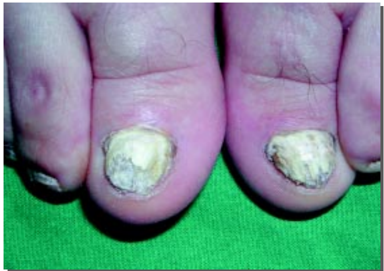
Figura 7. Onicomicosi distrofica totale da T. interdigitale di entrambi gli alluci.

Il paziente diabetico spesso ignora o trascura la presenza dell'infezione fungina, soprattutto a livello dei piedi, ritenen-