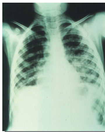
Figura 1. Polmonite da A. fumigatus in bambino con leucemia linfoblastica acuta in trattamento antilablastico. Il reperto radiologico è aspecifico nelle fasi iniziali, mentre nel decorso possono comparire segni di consolidamento o cavitazione.

E' stato dimostrato come l'accurato lavaggio delle mani sia la misura preventiva più efficace per evitare la trasmissione e quindi la colonizzazione da par-